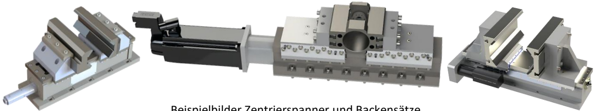
Beispielbilder Zentrierspanner und Backensätze